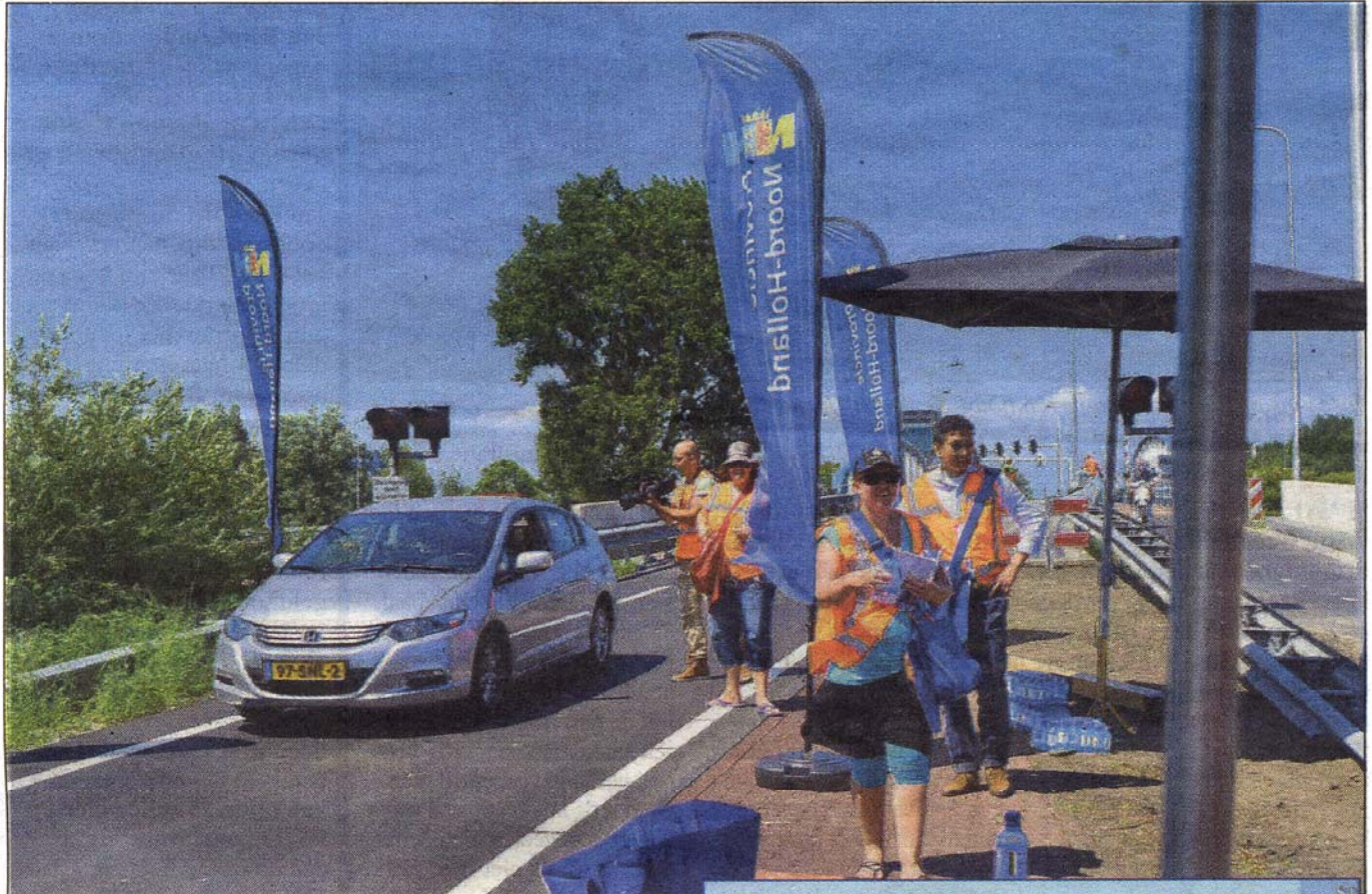
Medewerkers delen flesjes water uit aan de eerste gebruikers van de oprit.

SCHIPHOL-OOST – De nieuwe extra oprit naar de A9 richting Utrecht bij Schiphol-Oost werd donderdag 18 juli opengesteld voor al het autoverkeer. Vanaf nu is de hele noordelijke route van de nieuwe N201 voor al het verkeer volledig in gebruik.