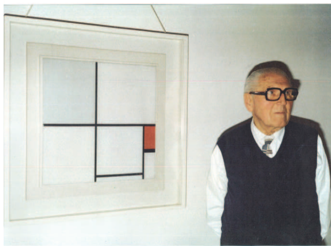
Cornelis van Eesteren

Kom naar het Bezoekerscentrum, maak kennis met Mondriaan, Van Eesteren en het ontstaan van het Bos.